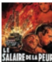
6/11 Le Salaire Du Peur