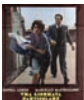
2/10 Una Giornata Particolare