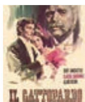
4/12 Il Gattopardo